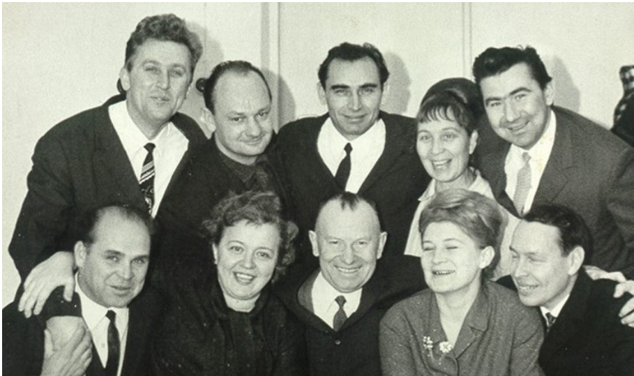
Коллектив кафедры нормальной физиологии 1966 год