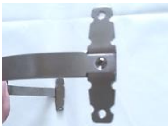
Рисунок 8. – Крепление боковых стабилизаторов к пластине

2.7. Для повышения устойчивости пластины перпендикулярно к её оси на ее концах устанавливаются стабилизаторы по принципу «ласточкин хвост», которые крепятся к пластине-импланту с помощью винтов (рис. 8).