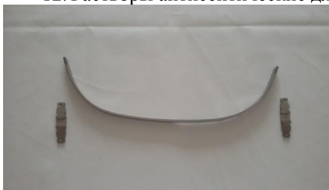
Рисунок 1. – Пластина-имплант