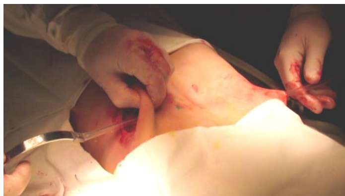
Рисунок 6. – Проведение пластины-импланта