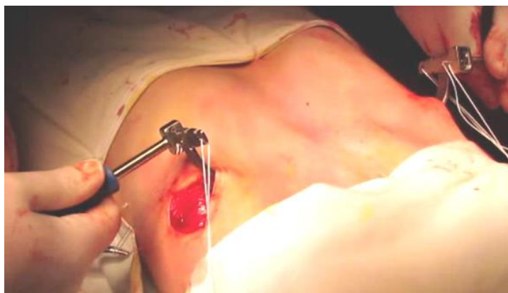
Рисунок 9. – Ротация пластины установочным инструментарием