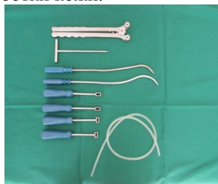
Рисунок 2. – Набор инструментов для постановки импланта