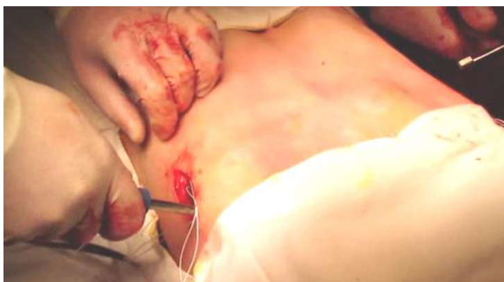
Рисунок 10. – Форма грудной клетки после поворота пластины

2.9. Торакоскопом проводится ревизия плевральной полости на наличие внутриплеврального кровотечения из межреберных сосудов и паренхимы легочной ткани. Кровотечение устраняется торакоскопической коагуляцией. Извлекается торакоскоп.