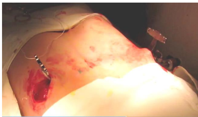
Рисунок 7. – Расположение пластины-импланта после проведения за грудиной

2.7. Для повышения устойчивости пластины перпендикулярно к её оси на ее концах устанавливаются стабилизаторы по принципу «ласточкин хвост», которые крепятся к пластине-импланту с помощью винтов (рис. 8).