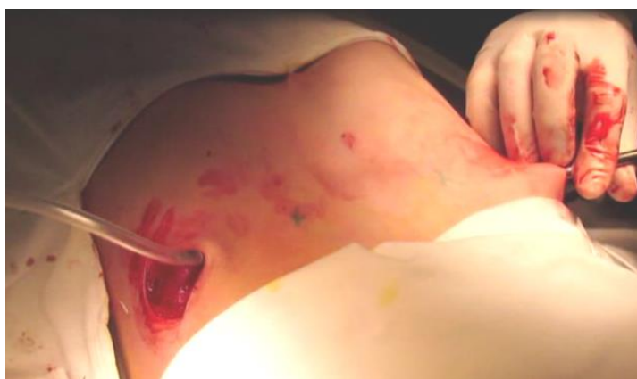
Рисунок 5. – Проведение силиконовой трубки

2.6. На конец проводника надевают силиконовую трубку и проводят в обратном направлении (рис. 5). К свободному концу силиконовой трубки, выведенной в рану, слева фиксируют подготовленную пластину-имплант и проводят ее с помощью силиконовой трубки на противоположную сторону (рис. 6). После проведения пластина располагается вогнутой поверхностью вверх (рис. 7).