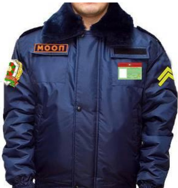
деловой стиль одежды