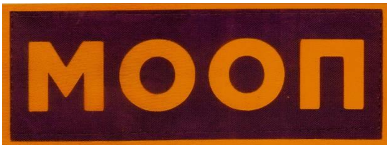
Нашивка для ношения на спине