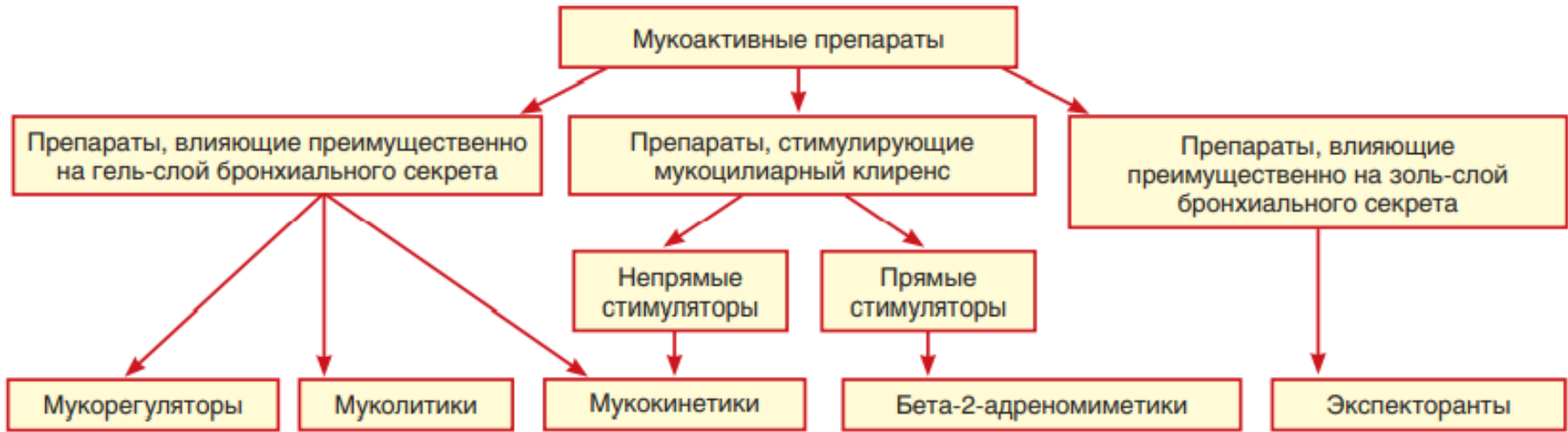
Рис. 1. Классификация мукоактивных препаратов по влиянию на мукоцилиарный клиренс и состав бронхиального секрета