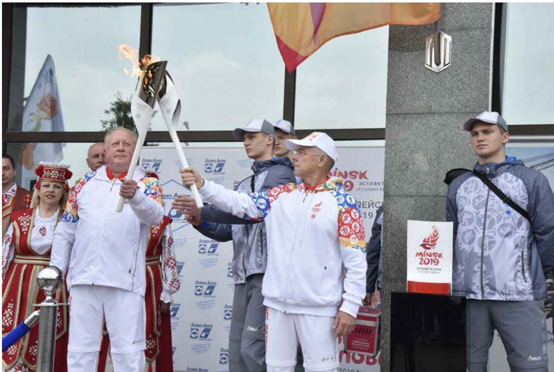
Огонь - символ спорта и высоких достижений