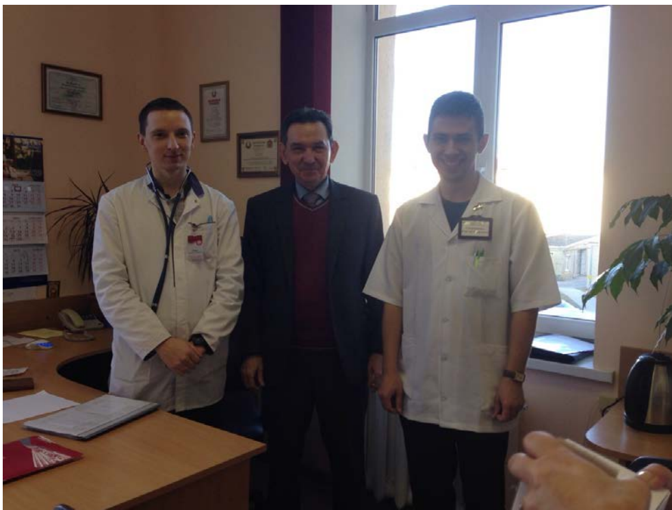
Приветствуем молодых сотрудников на кафедре