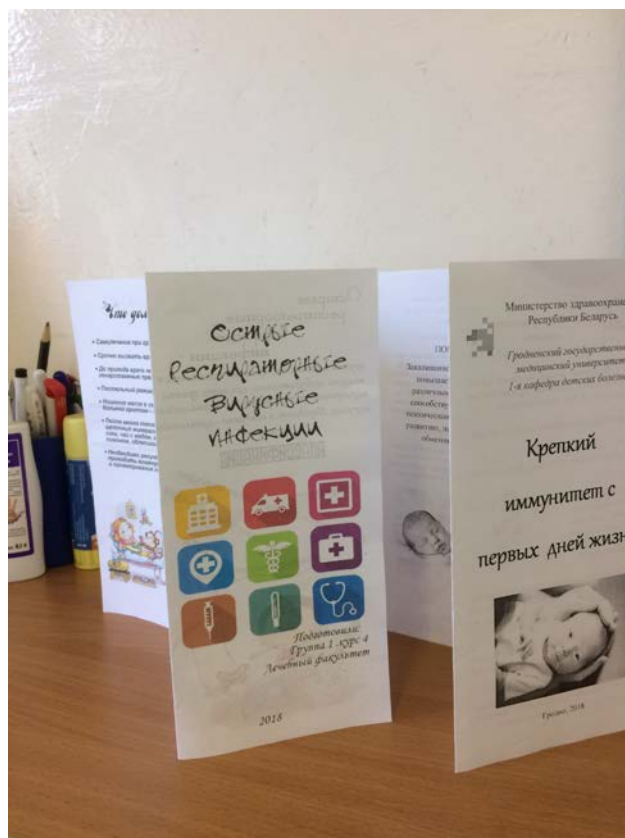
Пропаганда здорового образа жизни. Профилактика острых респираторных инфекций (материал подготовлен студентами 5 курса лечебного факультета). Буклеты размещены на информационных блоках в отделениях детского стационара