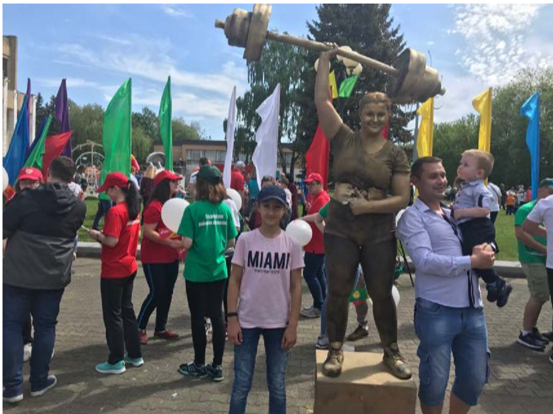
Участие сотрудников кафедры на эстафете "Пламя мира". Преемственность поколений в воспитании патриотизма