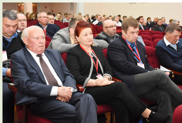
С уважением и любовью материал подготовили сотрудники кафедры общей хирургии ГрГМУ