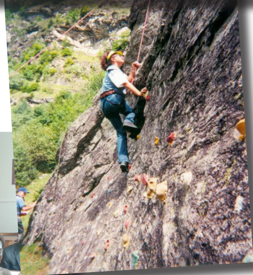
Покорение очередной вершины в Альпах