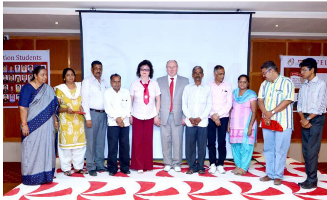
Индия. Делегация от ГрГМУ

Иностранные студенты в системе высшего образования стали обычным явлением. Однако иностранные абитуриенты выбирают не каждый вуз. Формирование положительного имиджа университета в международном образовательном пространстве – непростая задача, которую решает многочисленный коллектив университета. И в этой области