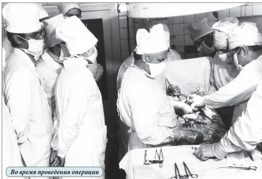
Во время проведения операции

С уважением, коллектив 1-й кафедры хирургических болезней