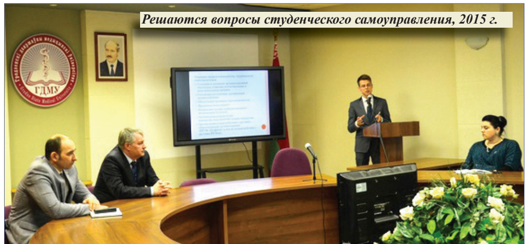
Решаются вопросы студенческого самоуправления, 2015 г.

В следующей беседе ознакомим читателей с естественным развитием художественной самодетельности университета. Ознакомим с увлекательным самовыражением студентов, содействующим освоению, распространению и сохранению ценностей любительского творчества.