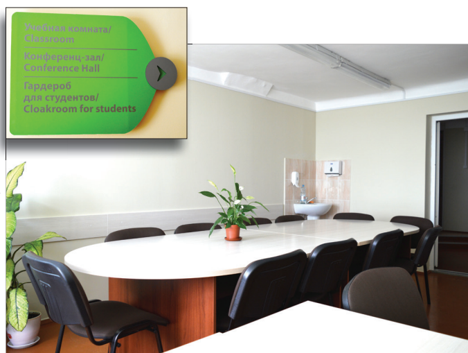
Учебная комната в ПКЦ