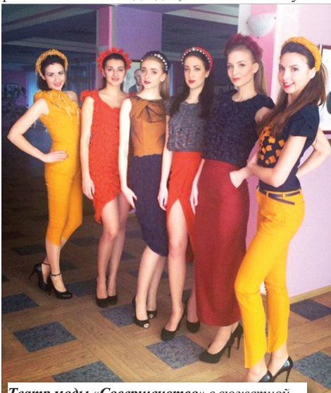
Театр моды «Совершенство» с сюжетной композицией «Мой Апрель», 2016 г.