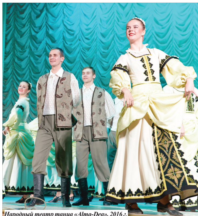
Народный театр танца «Alma-Dea», 2016 г.