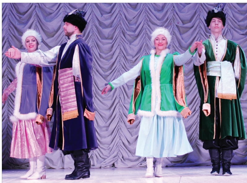
Хореографические и вокальные композиции ансамбля «Хабры»