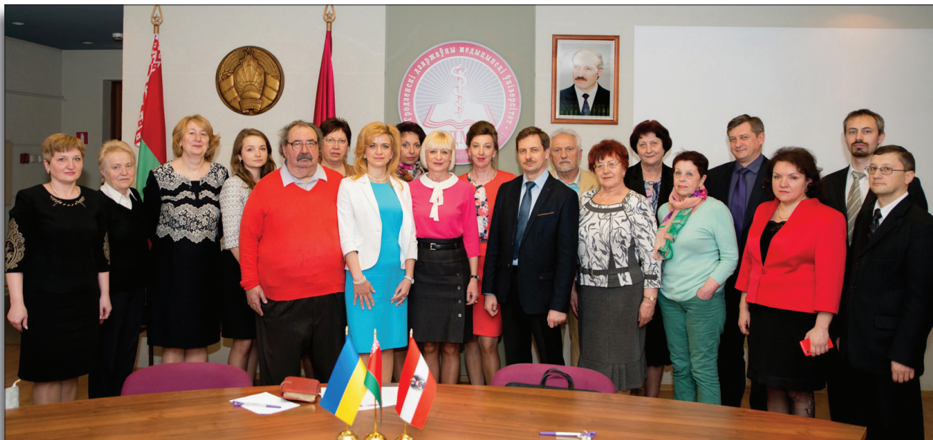
Участники седьмой научно-практической конференции с международным участием «Актуальные вопросы коморбидности сердечно-сосудистых и костно-мышечных заболеваний в амбулаторной практике», 2016 г.