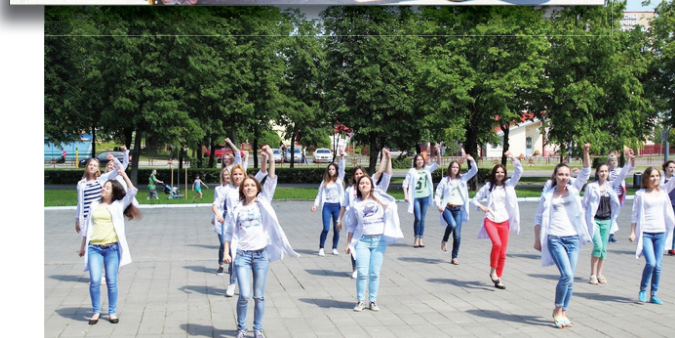
Студенты педиатрического факультета приняли участие во флешмобе