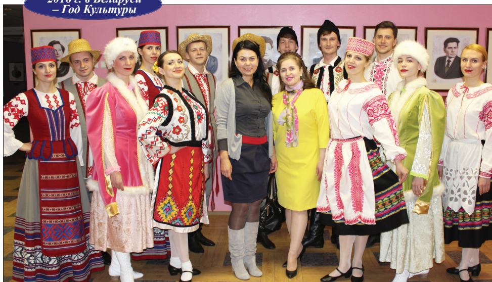
Памятное мгновение после концерта.

Коллектив народного ансамбля польской песни и танца «Хабры», участник многих международных фестивалей и конкурсов в 2016 г. отмечает свой 20-летний юбилей.