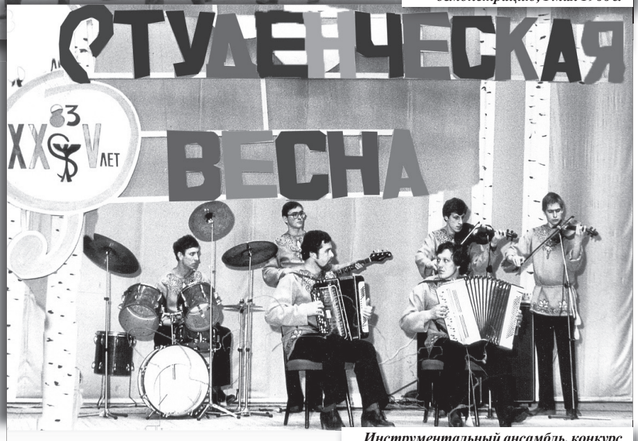
Инструментальный ансамбль, конкурс «Студенческая весна-1983»