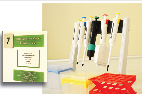
Оборудование процедурного кабинета