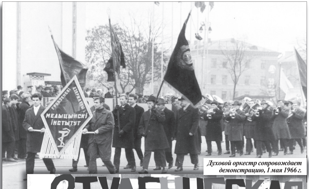
Духовой оркестр сопровождает демонстрацию, 1 мая 1966 г.

Каждый желающий студент может выбрать тот вид кружка или студии, который ему более близок и по душе и по его задаткам. К руководству художественными коллективами привлекаются мастера профессионального искусства, которые помогают участнику художественной самодеятельности выбрать тот жанр, посредством которого он сможет выразиться и обрести гармонию с самим собой. Гармония с самим собой устанавливает психологическое равновесие.