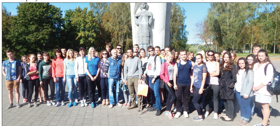
Памятное фото участников первенства медико-диагностического факультета по спортивному ориентированию