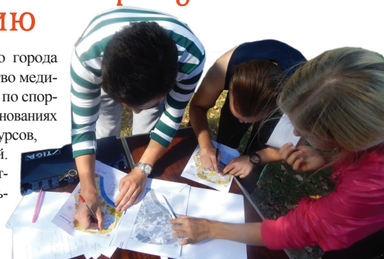
Участники изучают карту ориентирования

В Коложском парке нашего города 17 сентября состоялось первенство медико-диагностического факультета по спортивному ориентированию. В соревнованиях приняли участие команды пяти курсов, а также команда преподавателей. Перед началом соревнования участников приветствовал декан факультета и пожелал всем успехов. На соревнованиях присутствовали болельщики со всех курсов, которые активно поддерживали участников соревнования. В состав команды входили по четыре человека. Первые пары участников подходили к столу и в течение двух минут перерисовывали контрольные пункты на свою карту и отправлялись по маршруту. Протяжённость дистанции составила 3600 метров и