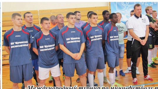
Международный турнир по мини-футболу памяти Чеслава Немена