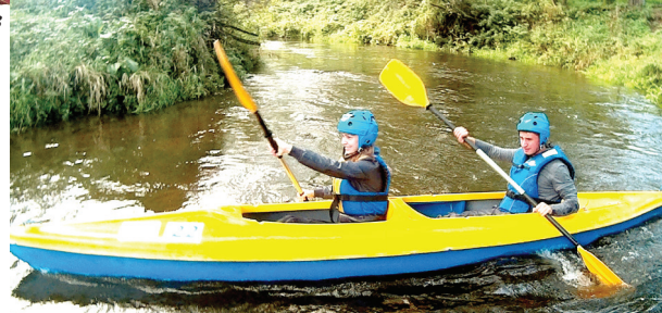
Сплав по реке