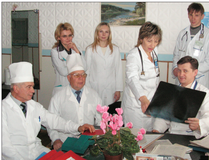
Консилиум в терапевтическом отделении УЗ ГКБ №2