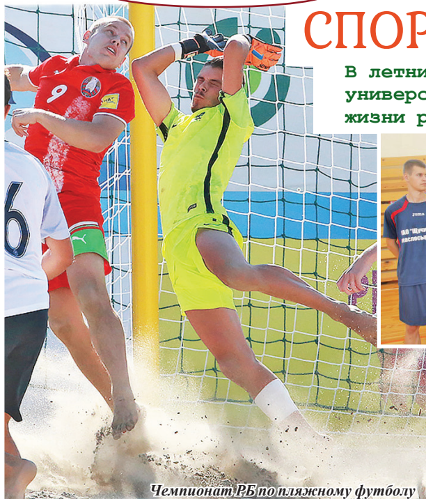
Чемпионат РБ по пляжному футболу

В летний каникулярный период студенты и сотрудники университета принимали активное участие в спортивной жизни региона.