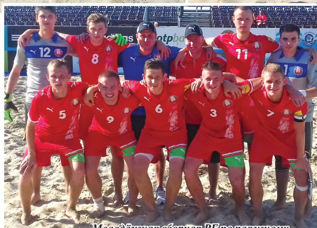
Молодёжная сборная РБ по пляжному футболу