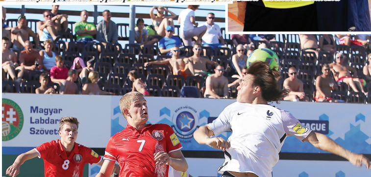
Чемпионат РБ по пляжному футболу