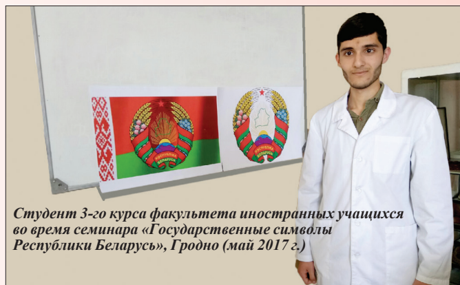
Студент 3-го курса факультета иностранных учащихся во время семинара «Государственные символы Республики Беларусь», Гродно (май 2017 г.)

ромбы вверху и внизу орнамента – символ продолжения жизни, возобновляющихся хлебов.