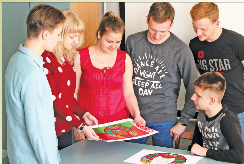
Студенты лечебного факультета во время обсуждения и толкования основных элементов орнамента Государственного флага Республики Беларусь, Гродно (май 2017 г.)

Государственный флаг Республики Беларусь – официальный государственный символ Республики Беларусь. Принят 14-го мая 1995 г. по результатам референдума.