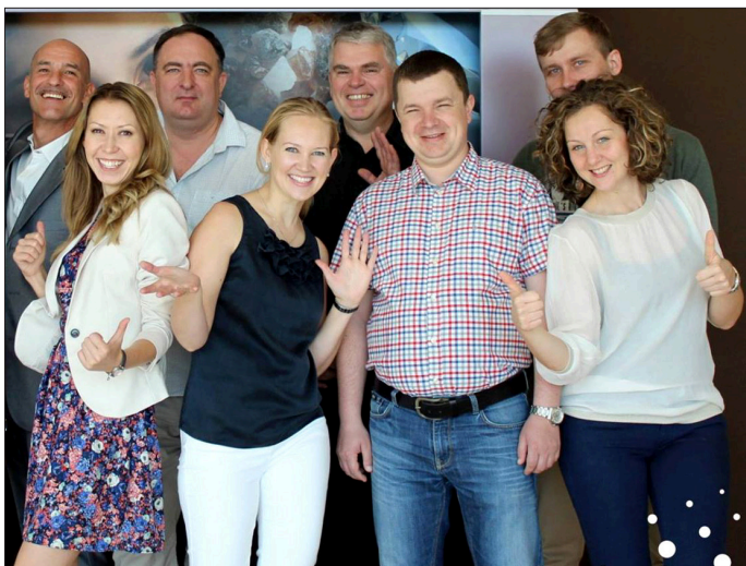
Конференция в Дрездене (Германия) 2015 г.

Материал подготовлен коллективом кафедры дерматовенерологии