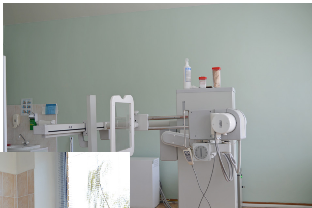
Аппарат рентгеновский диагностический стационарный «Космос. Универсал»

сопровождения с участием специалистов поликлиники, много других опций. Учреждение стало более конкурентоспособным. Во-вторых, есть мудрое изречение: кадры решают всё, а если кадровый ресурс ещё и хорошо обучен, – это решает многие задачи и можно двигаться на очередную