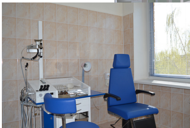
Диагностическая лор-установка «Модула»

конечно же, возможность получения дополнительной прибыли, спонсорской помощи нашему учреждению, а для партнёров – проведение совместных разноплановых акций, медицинского