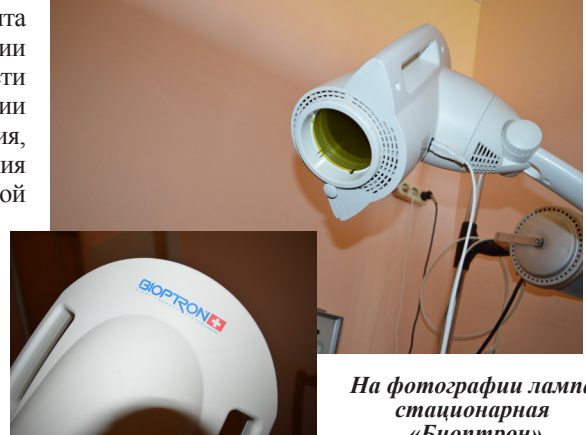
На фотографии лампа стационарная «Биоптрон»

Сейчас это отслеживается путём ежеквартального анкетирования пациентов и по обращениям в Книгу замечаний и предложений. Необходимо отметить, что количество негативных обращений уменьшилось, по результатам анкетирования удовлетворённость пациентов