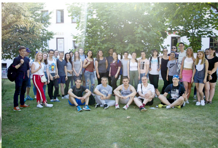
Каждый принявший участие, несомненно, получил огромный заряд позитива и хорошего настроения!