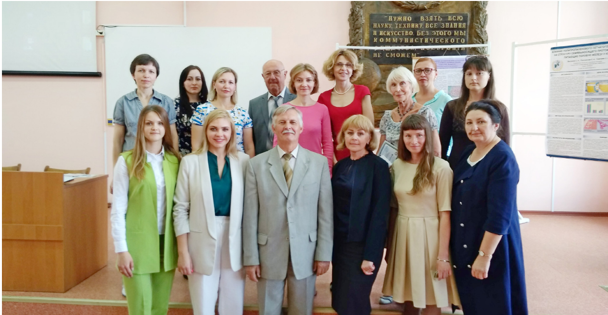
Участники юбилейной научно-практической конференции с международным участием «Актуальные проблемы гистологии, цитологии и эмбриологии». Памятное фото, 2018 г.

22 июня 2018 г. в Гродненском государственном медицинском университете прошла научно-практическая конференция с международным участием «Актуальные проблемы гистологии, цитологии и эмбриологии», посвящённая 60-летию организации кафедры гистологии, цитологии и эмбриологии ГрГМУ. В работе конференции приняли участие учёные из профильных научных и учебных учреждений Республики Беларусь и стран зарубежья (России, Украины), также врачи-клиницисты из учреждений здравоохранения.