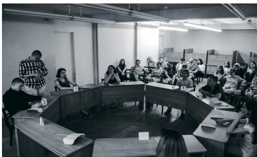
Город засыпает – просыпается Мафия!