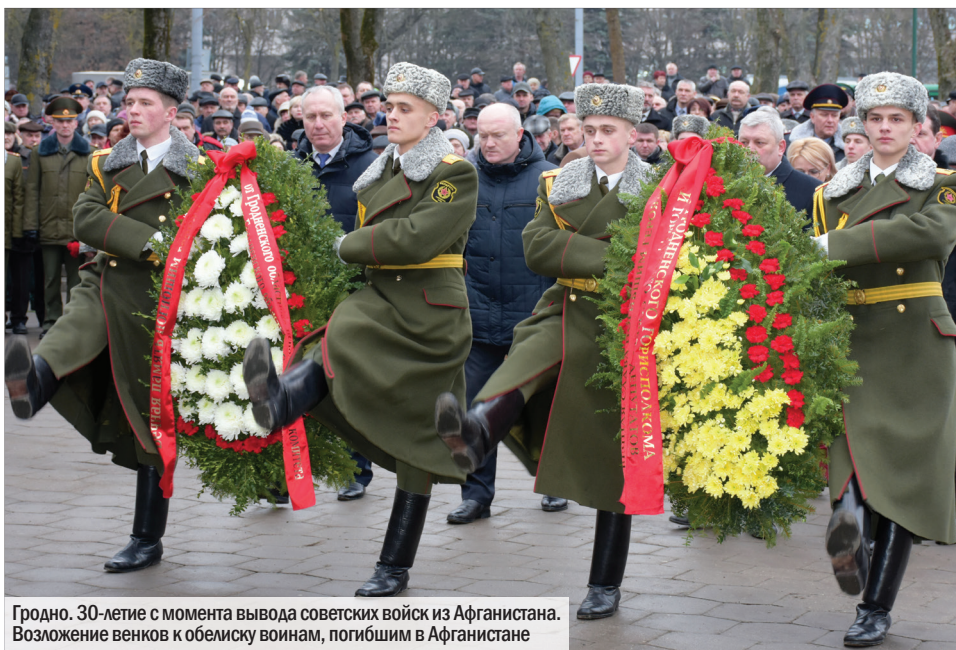
Гродно. 30-летие с момента вывода советских войск из Афганистана. Возложение венков к обелиску воинам, погибшим в Афганистане

Ректорат, Совет ветеранов, профком сотрудников и студентов