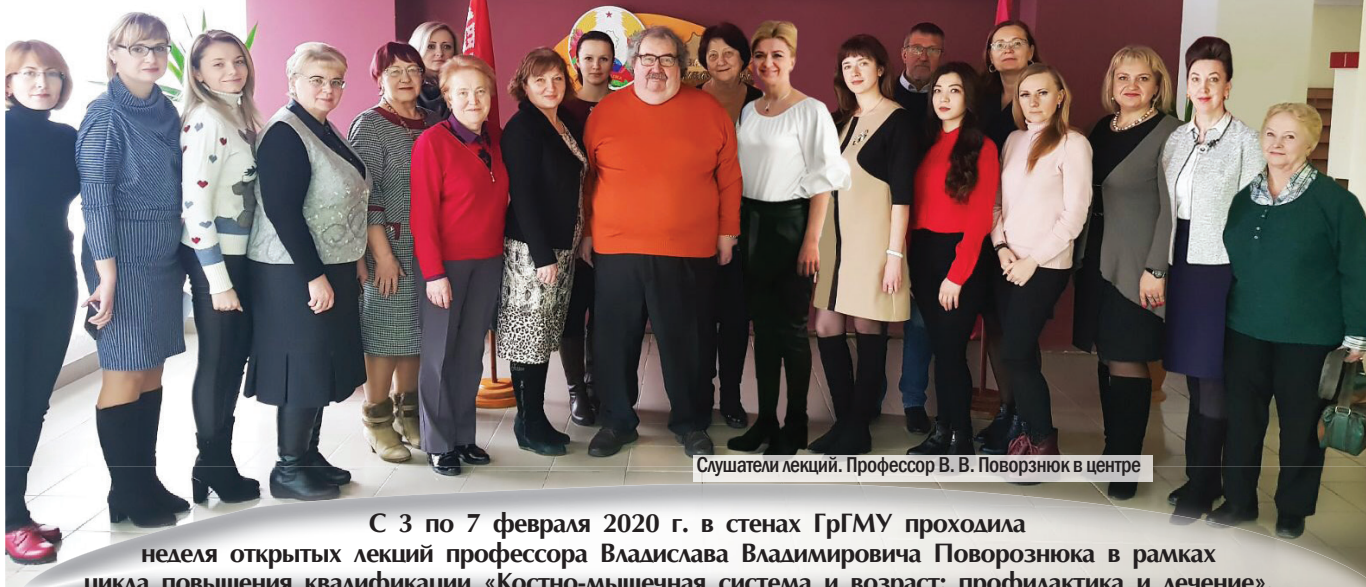
Слушатели лекций. Профессор В. В. Поворознюк в центре

С 3 по 7 февраля 2020 г. в стенах ГрГМУ проходила неделя открытых лекций профессора Владислава Владимировича Поворознюка в рамках цикла повышения квалификации «Костно-мышечная система и возраст: профилактика и лечение».