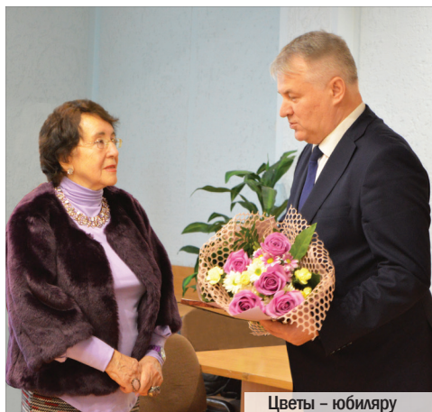
Цветы – юбиляру