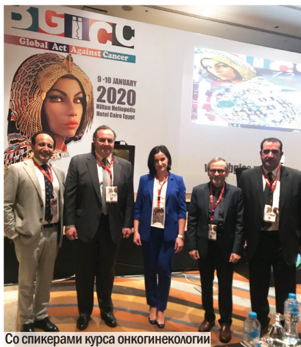
Со спикерами курса онкогинекологии