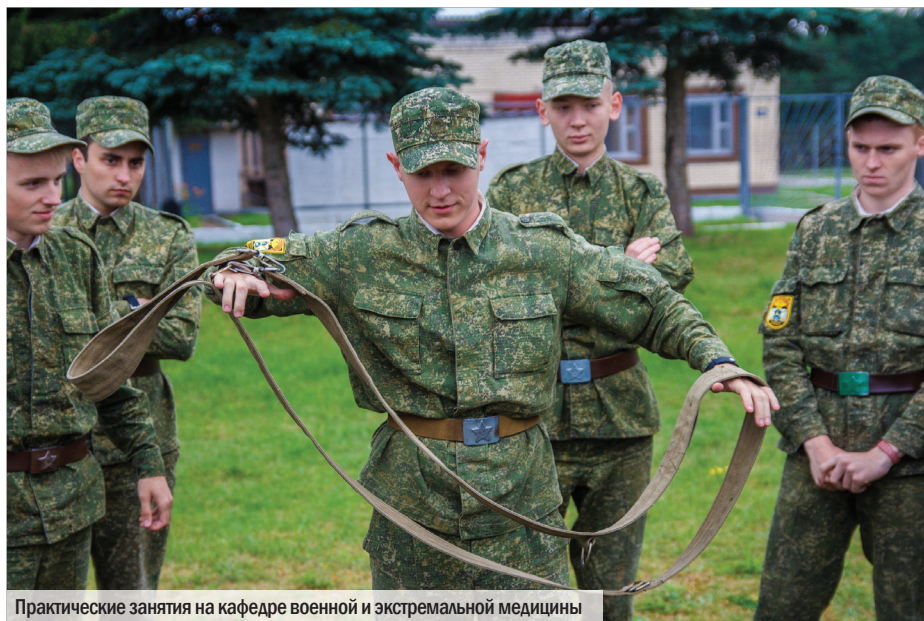
Практические занятия на кафедре военной и экстремальной медицины

шедший уже более чем столетний путь, имеющий большое значение в жизни нашего общества. Традиционно с этим праздничным днем женщины поздравляют мужчин, девушки – юношей, девочки – мальчиков. Это действительно всеобщий праздник. Необходимо также отметить, что в