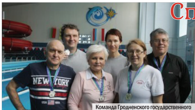
Команда Гродненского государственного медицинского университета