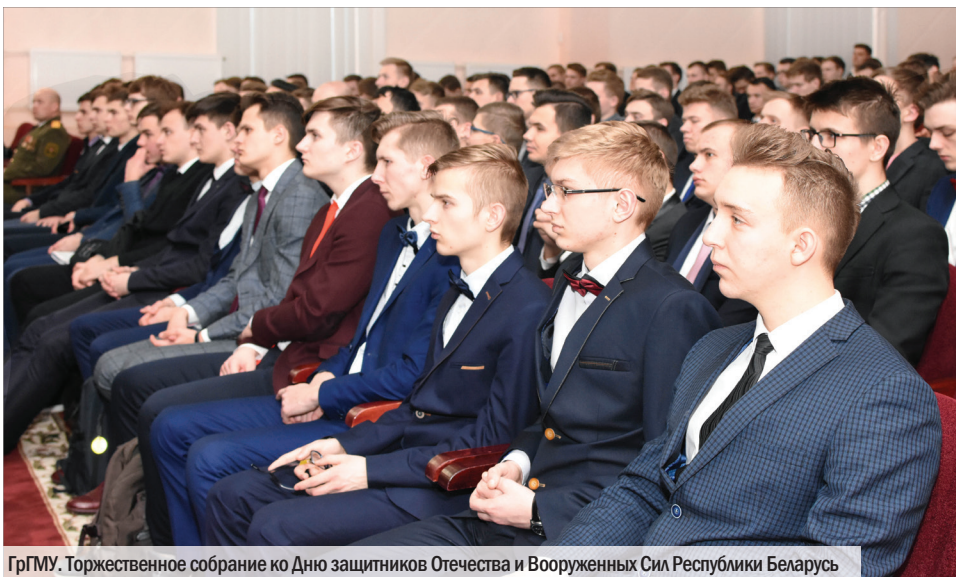
ГрГМУ. Торжественное собрание ко Дню защитников Отечества и Вооруженных Сил Республики Беларусь