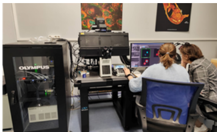
Конфокальный лазерный сканирующий микроскоп