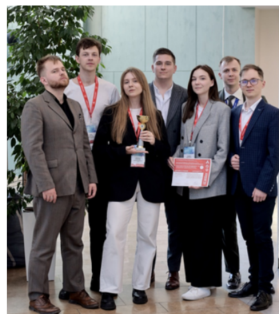
Олимпиада по кардиологии

Они решали видео-задачи и текстовые кейсы, достойно отвечали на каверзные вопросы модераторов и были награждены памятными призами за проявленные профессионализм и креатив.