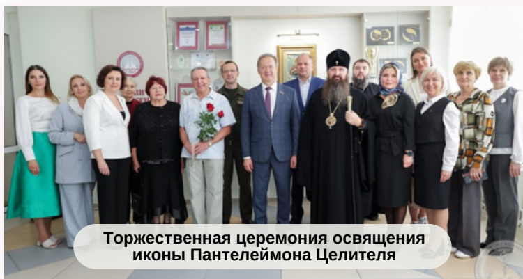
Торжественная церемония освящения иконы Пантелеймона Целителя