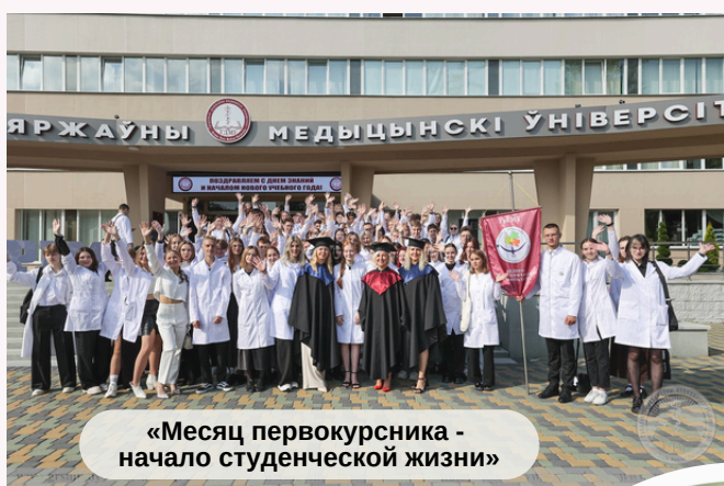
«Месяц первокурсника - начало студенческой жизни»