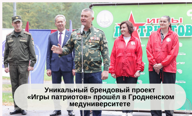
Уникальный брендовый проект «Игры патриотов» прошёл в Гродненском медуниверситете