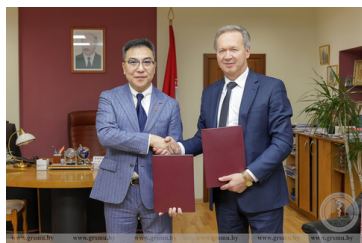
договор о сотрудничестве с Благотворительным фондом поддержки обучения и развития талантливых студентов КНР