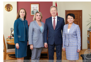
договоры о сотрудничестве с гимназией №1 и средней школой №3 г. Островеца