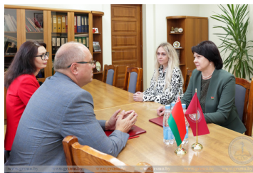
договоры о сотрудничестве со средней школой №31 г. Гродно и гимназией №1 г. Волковыска