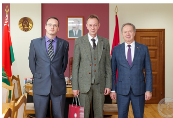
соглашение о сотрудничестве с центром спортивной медицины ФМБА России