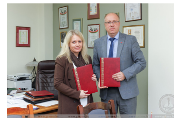
меморандум о сотрудничестве с Российским центром науки и культуры в Гродно