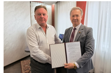
договор о сотрудничестве с СПК «Озеры Гродненского района»