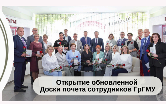
Открытие обновленной Доски почета сотрудников ГрГМУ