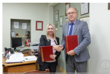
договор о сотрудничестве со средней школой №9 г. Мозыря