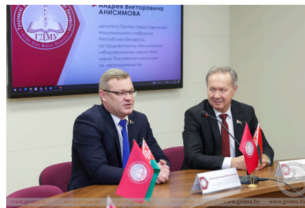
Материал подготовил отдел по связям с общественностью и маркетингу

В рамках диалоговой площадки были подняты темы патриотизма и единства, социальные темы. Андрей Викторович рассказал о гражданских инициативах, о том, как работает депутатский корпус, с какими проблемами граждане обращаются к представителям власти и как они решаются.