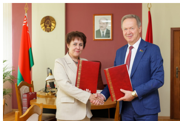
договор о сотрудничестве со средней школой №4 г. Столбцы