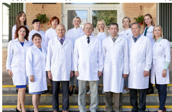
Материалы предоставлены кафедрой нормальной физиологии