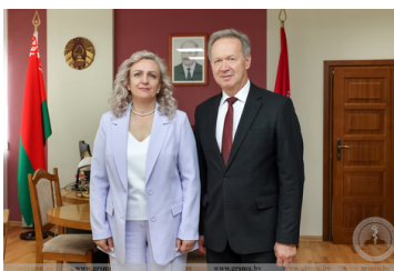
договор о сотрудничестве с гимназией г. Калинковичи