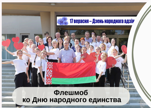
Флешмоб ко Дню народного единства