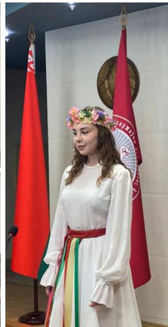
Материал подготовил отдел по связям с общественностью и маркетингу