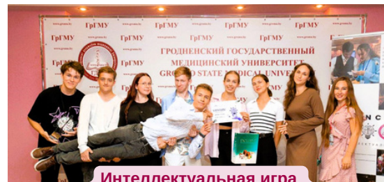
Интеллектуальная игра Science Quiz прошла в ГрГМУ в рамках «Месяца первокурсника»

Игра собрала около 250 студентов с разных факультетов Гродненского медуниверситета, но атмосфера единения чувствовалась во всём.