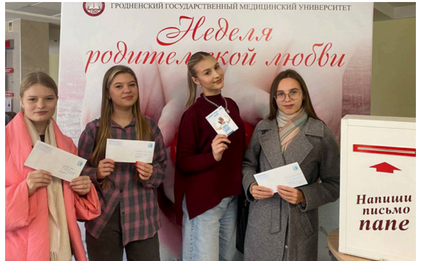
Материал подготовил отдел по связям с общественностью и маркетингу

Такие мероприятия всегда наполняют теплом и радостью, дарят волну положительных эмоций и прекрасное настроение не только организаторам, но и участникам.