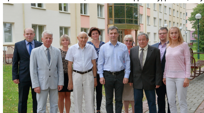
Коллектив кафедры неврологии и нейрохирургии, 2019