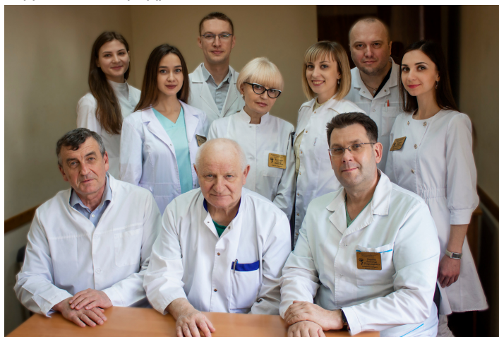
Профессорско-преподавательский состав кафедры онкологии

Преподавание онкологии в Гродненском медицинском институте осуществлялось с 1985 года на базе кафедры госпитальной хирургии. 5 марта 1993 года на основании Ученого Совета приказом ректора №24-Л-1 была организована самостоятельная кафедра онкологии. С 1998 года с целью оптимизации учебного процесса кафедра онкологии была объединена с кафедрой лучевой диагностики и лучевой терапии в единую кафедру. С 2011 года вновь произошло обособление дисциплин, каждая из которых стала преподаваться на отдельной кафедре.