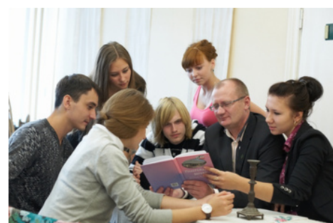
Литературный клуб "КАТАРСИС"

свое мастерство в приготовлении блюд разных стран. Более 20 лет в ГрГМУ существует литературный клуб «Катарсис», деятельность которого направлена на развитие и популяризацию литературного жанра, воспитание художественного вкуса и навыков. Все студенты, литературное слово которых требует внимания, с помощью объединения могут быть услышаны. Некоторые участники даже издают свои литературные сборники.