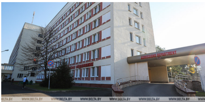
Брестская областная клиническая больница

Факультет повышения квалификации и переподготовки в целях расширения сферы образовательных услуг инициировал открытие филиалов кафедр университета в региональных учреждениях здравоохранения: