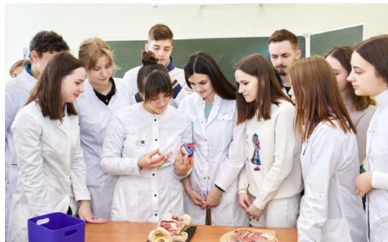
Один день из жизни студента

Студенты лечебного факультета отличаются не только большими достижениями в учебной деятельности, но являются активными участниками общественной жизни университета, также представляя вуз и за пределами Alma Mater. Неоднократно студенты занимали призовые места на внутривузовских, городских, республиканских и международных соревнованиях, конкурсах и конференциях.