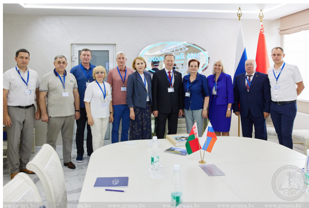
IX Форум регионов Беларуси и России

Не остается в стороне и многолетнее сотрудничество с вузами Российской Федерации. Неоднократно делегации из университетов России посещали наш университет. В свою очередь и представители Гродненского медуниверситета обмениваются опытом, ведут совместную работу с российскими коллегами и партнерами. Участвуют в трансграничных форумах и симпозиумах.