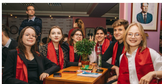
Интеллектуальная игра «ScienceQuiz»

Желающим заявить о себе и своих талантах ГрГМУ предлагает поучаствовать в ежегодных конкурсах «Королева студенчества», «Мистер университет», «Студент года».