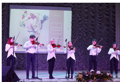
Ансамбль скрипачей "Кварта"

Для желающих проявить себя в актерском мастерстве, музыке, моделинге и танцах в нашем университете есть несколько кружков. Участники не остаются за кадром, у них есть возможность выступать на мероприятиях университетского и даже республиканского масштаба.