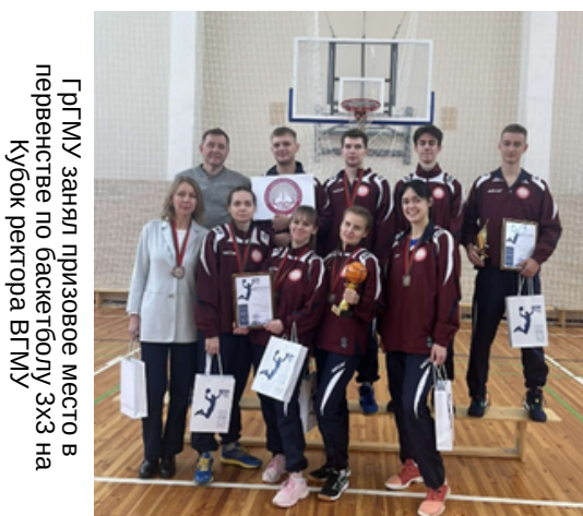
ГрГМУ занял призовое место в первенстве по баскетболу ЭХЗ на Кубок ректора ВГМУ

Уже более 5 лет мы принимаем активное участие в республиканском гражданско-патриотическом марафоне «Вместе – за сильную и процветающую Беларусь», где у студентов есть прекрасная возможность почувствовать дух сплоченности не только в своей команде, но и с другими университетами страны. В 2023 году студенты ГрГМУ завоевали 2 место, а в 2022 – 3 место.