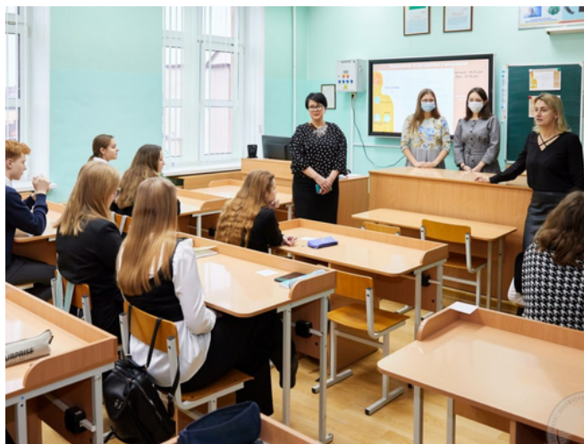
Наталья КОНОВОД Фото из архива

Помимо этого, свои практические навыки студенты совершенствуют во время занятий, которые проходят не только в учебных корпусах вуза, но и на базах больницы, поликлиник и других учреждений здравоохранения.