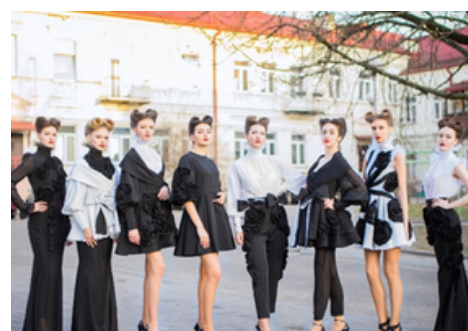
Театр моды «Совершенство»

Также на базе общежитий осуществляют свою деятельность любительские объединения. Для желающих узнать больше о белорусской национальной культуре и ремеслах отличным вариантом является коллектив «Белорусочка». Тем, кому интересен фито-дизайн, арт-дизайн и декор, подойдет любительское объединение «ДЕКОРИК». Любителям кулинарии университет предлагает объединение «Кухня народов мира». Здесь участники могут совершенствоваться