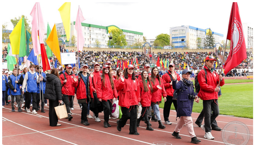
Марафон «Вместе – за сильную и процветающую Беларусь»

Кроме того, с 2022 года в университете проводятся турслеты. На протяжении двух дней студенты соревнуются в различных спортивных конкурсах, показывают творческие номера и окунаются в походную жизнь. Для студентов также проходит круглогодичная Спартакиада. Недавно, а именно в июне 2023 года, состоялось награждение самых быстрых, сильных и ловких.