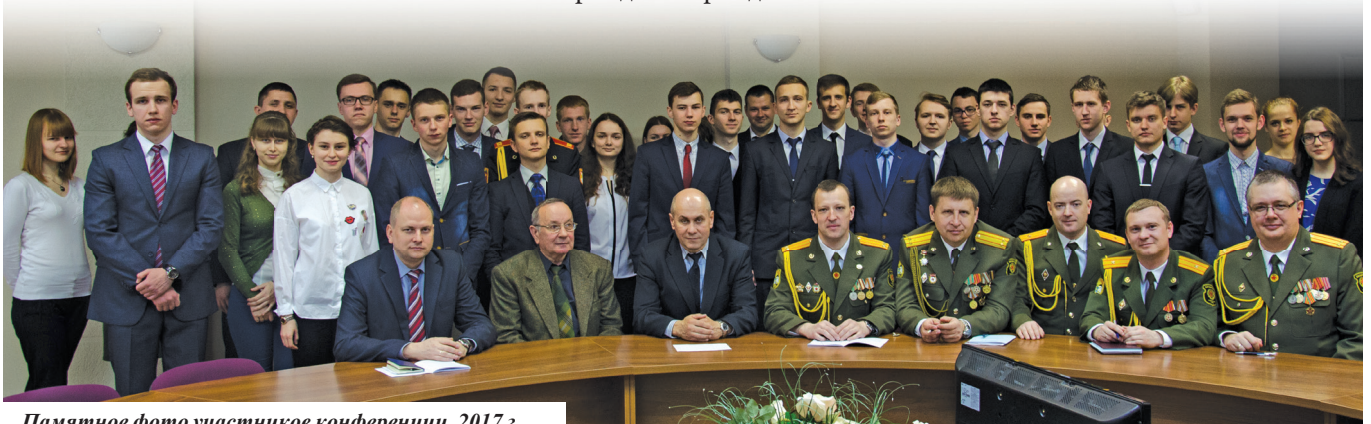
Памятное фото участников конференции, 2017 г.

преподаватель кафедры военной и экстремальной медицины, майор медицинской службы