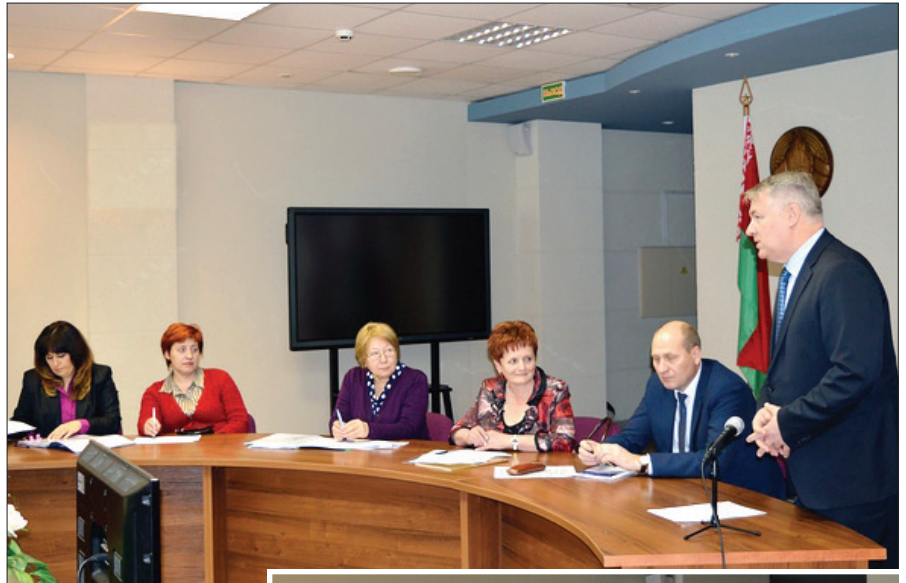
Работа экспертной комиссии в Гродненском государственном медицинском университете

По итогам проверки эксперты рекомендовали наш университет на подтверждение Премии Правительства Республики Беларусь.