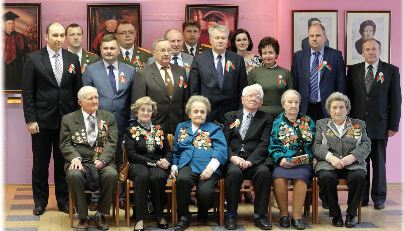
Фотохроника. Чествование ветеранов Великой Отечественной войны. ГрГМУ, 2016 год

РЕКТОРЫ И ПРОФЕССОРА ГРОДНЕНСКОГО ГОСУДАРСТВЕННОГО МЕДИЦИНСКОГО УНИВЕРСИТЕТА