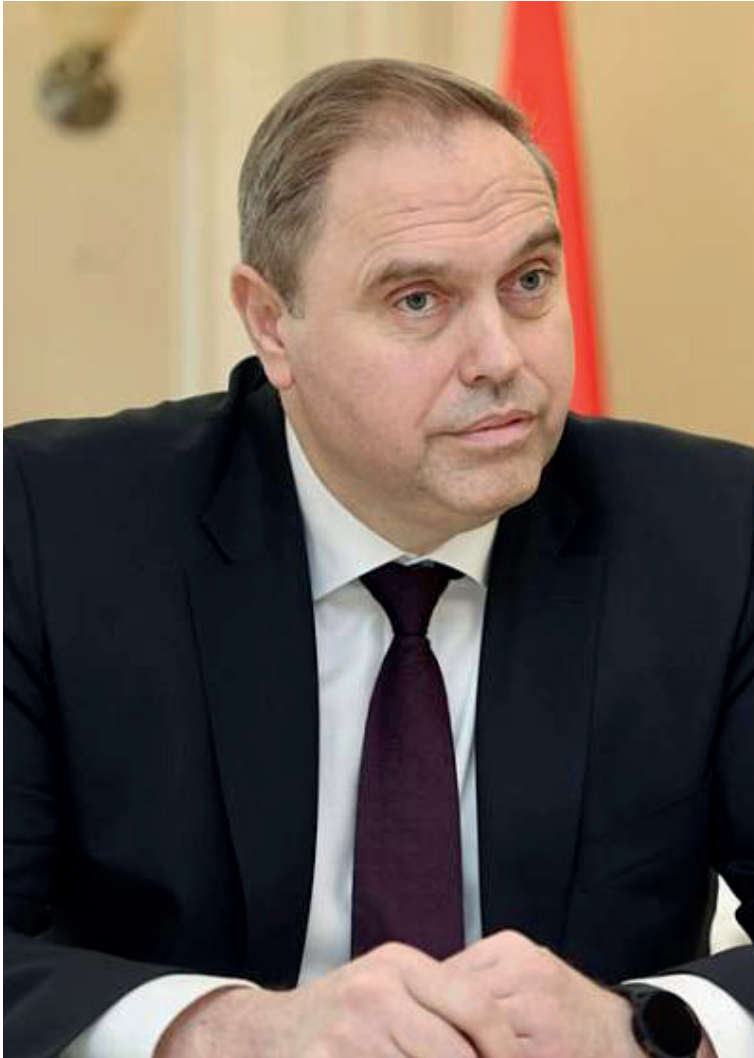
Председатель Гродненского областного исполнительного комитета