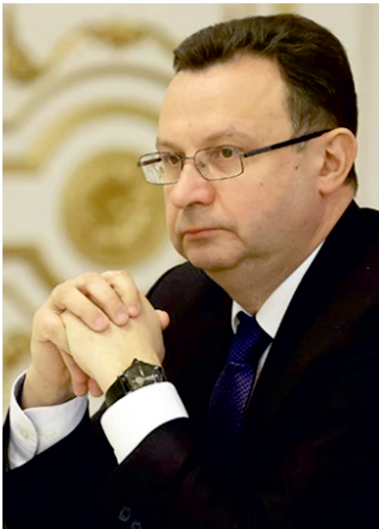
Министр здравоохранения Республики Беларусь