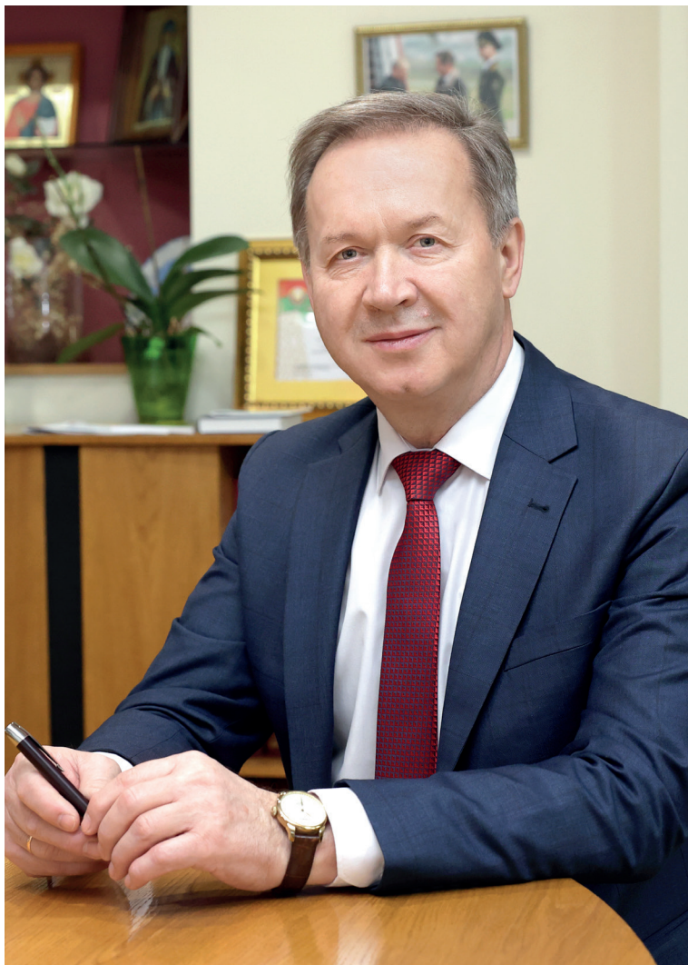
Ректор университета, профессор