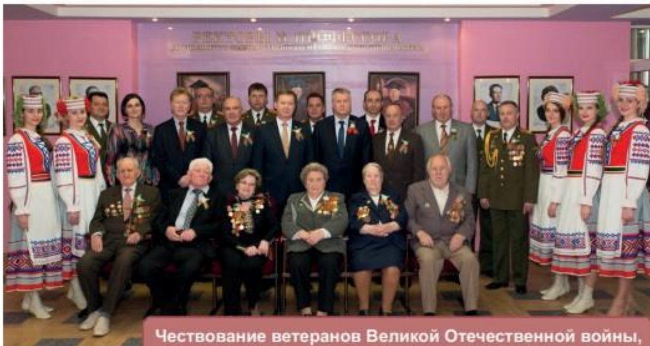
Чествование ветеранов Великой Отечественной войны, УО «ГрГМУ», 5 мая 2015 года

Всем, кто выстоял, выжил, кто смог От фашистов страну защитить, Всем вам низкий поклон, дай вам Бог Ещё долго и счастливо жить!