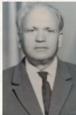
БЕЛЬМАН Хаим Лейвикович