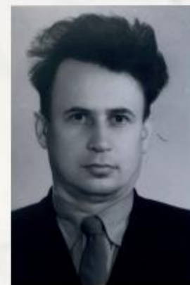
ЛУЦЕНКО Степан Митрофанович