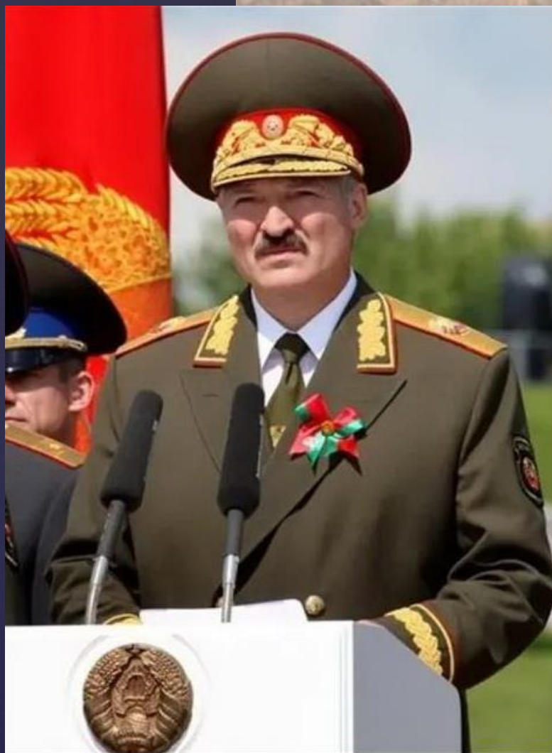
Президент Республики Беларусь Александр Лукашенко

«В наших умах и сердцах не должно быть места агрессии и насилию. Нельзя допустить новых кровавых конфликтов. Этого требует как историческая память, так и забота о благополучии будущего мирового сообщества».