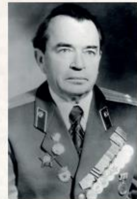
НЕЧИПОРЕНКО Александр Захарович