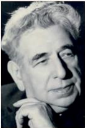
ГРОБШТЕЙН Семён Самойлович