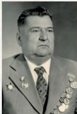
ЖИЛИНСКИЙ Пётр Яковлевич