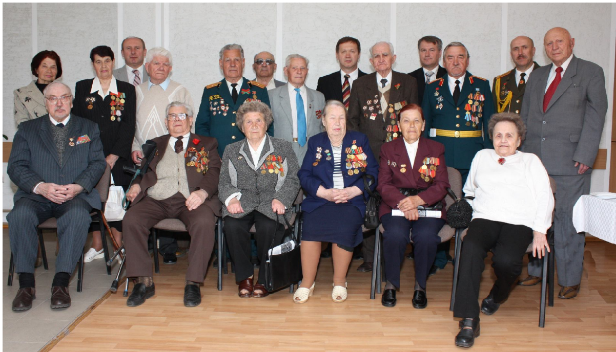
Ветераны Великой Отечественной войны Гродненского государственного медицинского университета накануне празднования Великой Победы по доброй традиции снова вместе

РЕКТОРАТ, ПРОФКОМ СОТРУДНИКОВ, СОВЕТ ВЕТЕРАНОВ