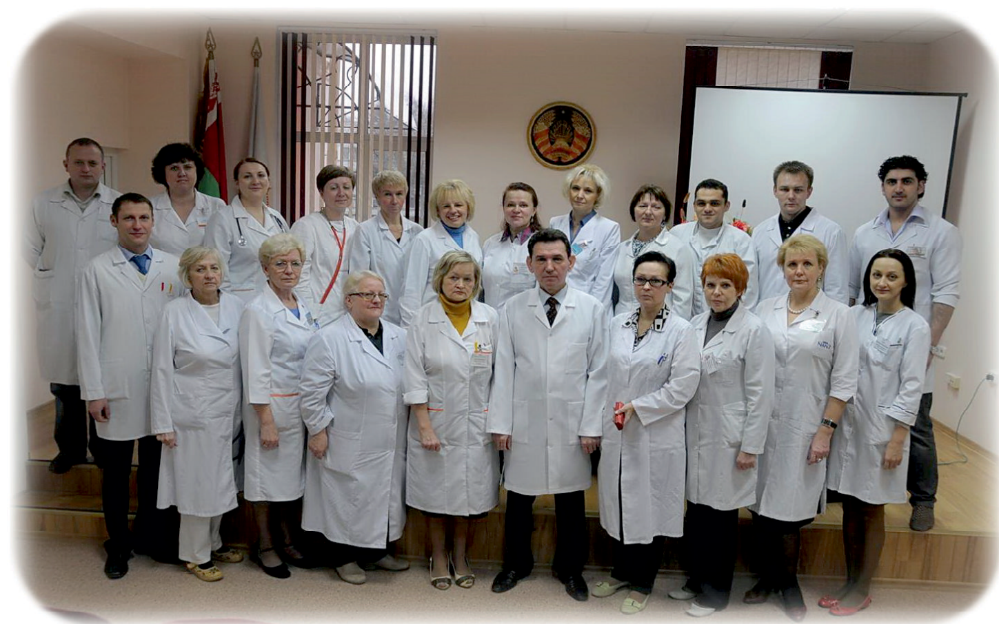
Сотрудники 1-й и 2-й кафедр детских болезней - единый коллектив