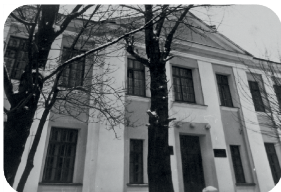
Бывший корпус университета (Антонова № 21)