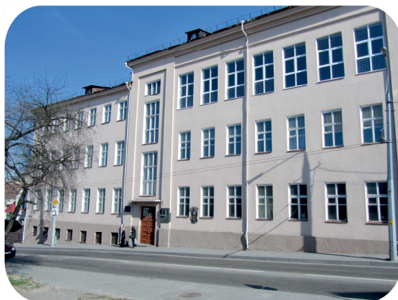
Лабораторный корпус (Б.Троицкая № 4)