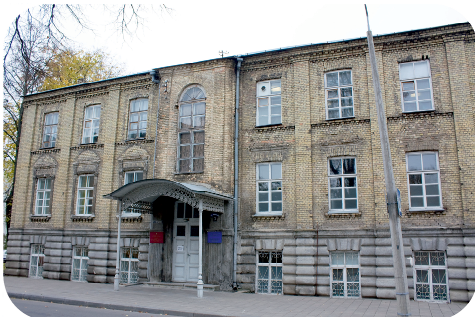
Учебный и научно-исследовательский корпус (Свердлова №3)

Пройдем по улице Замковой . Здесь расположено почти четырехвековое здание по адресу Замковая, 5 , кото-