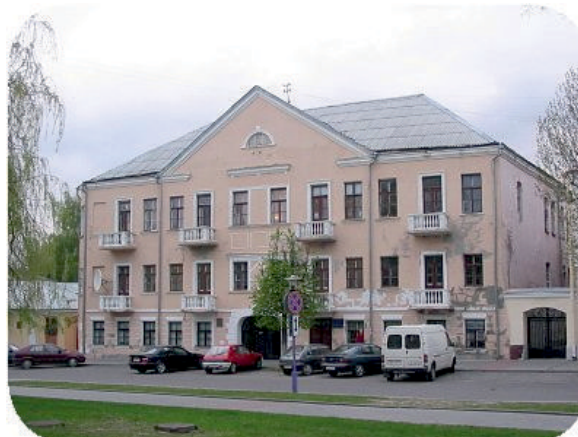
Общежитие № 1 (Замковая №5)