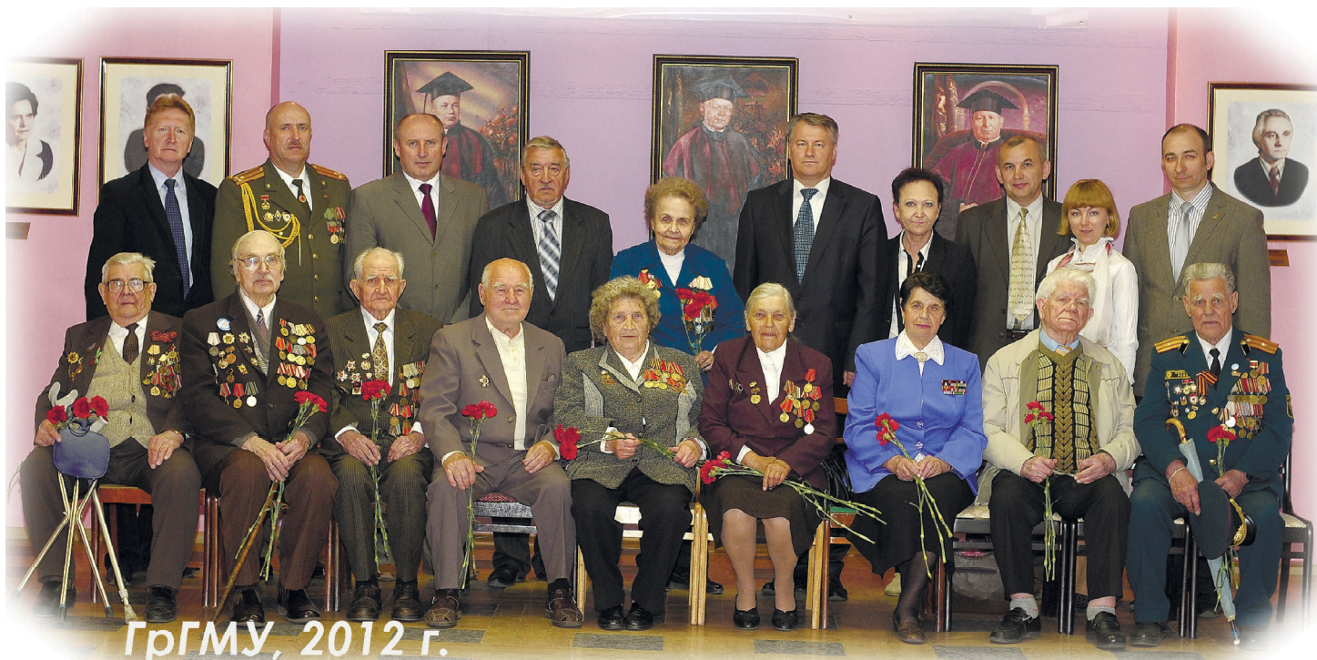
ГрГМУ, 2012 г.