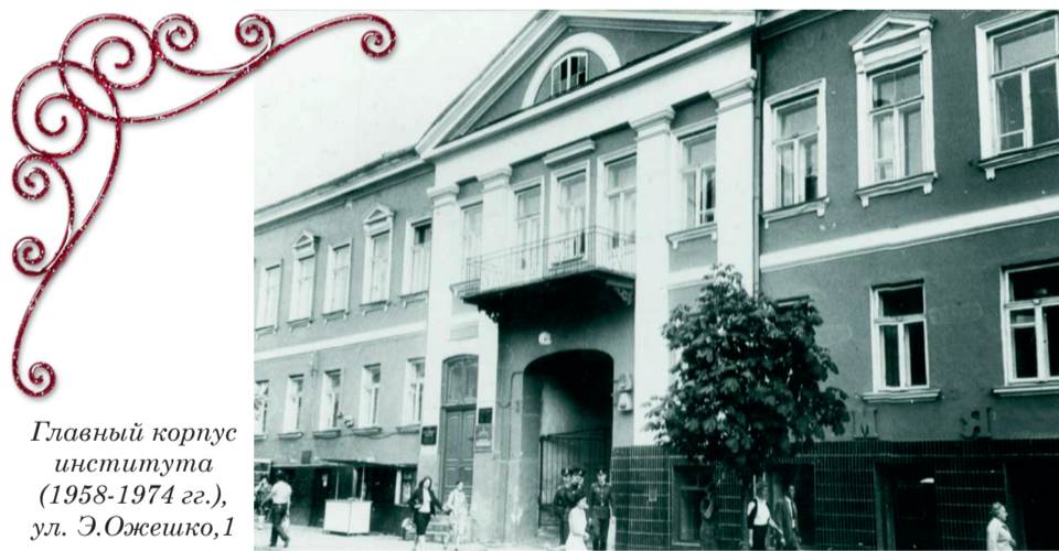
Главный корпус института (1958-1974 гг.), ул. Э.Ожешко, 1