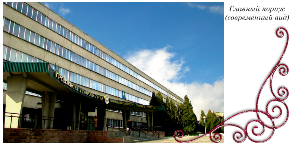
Главный корпус (современный вид)