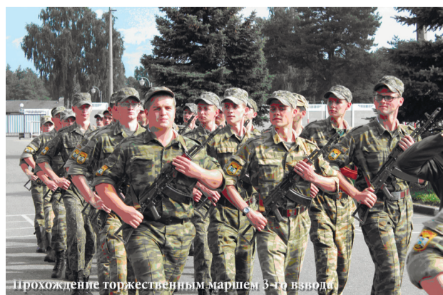
Прохождение торжественным маршем 3-го взвода

И вот, 8 июля в 8.30 утра 68 молодцев собрались и построились около КПП 6-й отдельной механизированной бригады (омбр) в предвкушении армейской жизни и уже без особых иллюзий по поводу безоблачного будущего на ближайшие недели. После построения нас отвели в расположение тан-