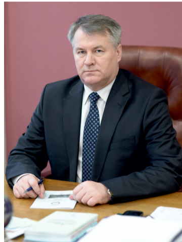
Уважаемые преподаватели, студенты и выпускники нашего университета!

Я всегда любил, люблю и буду любить свою Alma Mater. Желаю успехов всему преподавательскому составу, всем студентам, аспирантам, всем сотрудникам, здоровья, счастья, добра и процветания!