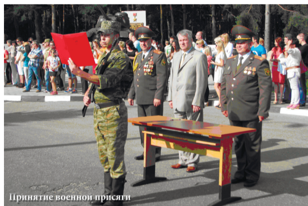
Принятие военной присяги