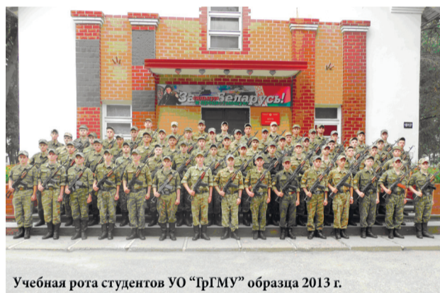
Учебная рота студентов УО "ГрГМУ" образца 2013 г.

Получив военную форму (это заняло около трех часов, так как то штаны маленькие, то фуражка велика и т.д.) и построившись перед вещевым складом, мы узнали, что на четыре недели поселяемся в казарме танкового батальона, и у нас один раз в неделю, в воскресенье, возможно, будет увольнительная. По рядам бывших четверокурсников пробежала волна лёгкой паники и, повесив носы, колонна потянулась с Фолюша собирать сумки и баулы со всем необходимым для проживания в воинской части.