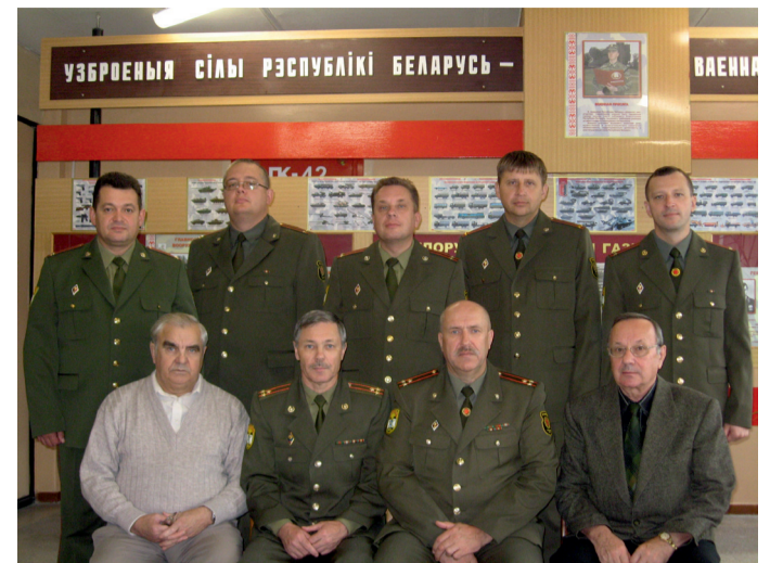
Преподавательский состав военной кафедры 2013 год

В год своего 45-летия личный состав военной кафедры, бережно сохраняя традиции, заложенные предшественниками, готов к решению новых военно-медицинских профессиональных задач.