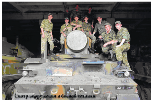
Смотр вооружения и боевой техники